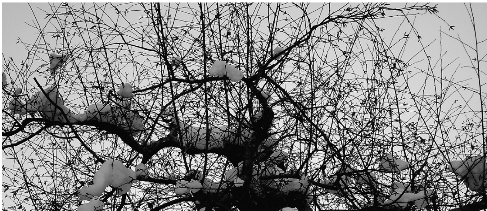
Winter – das stille Hoffen auf den Frühling.