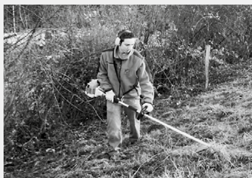
Glauben in der Tat: Bilder vom Einsatz der Firmlinge