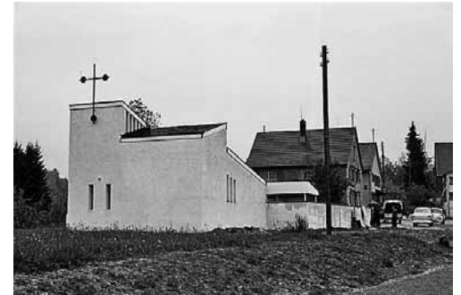
(Kapelle St. Josef)

26. Januar, 20 Uhr Theologie heute III: «Die Vielfalt der Jesus-Bilder»: Dorothee Sölle/Luise Schottroff, Jesus von Nazareth