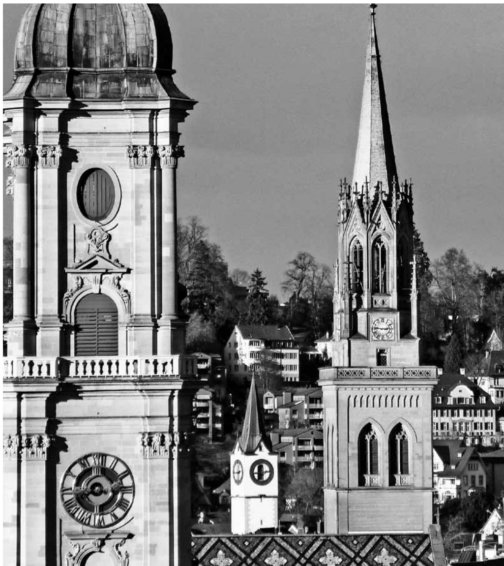
Die Türme von Dom und St.Laurenzen. Zusammen könnten sie ein Symbol der Dreieinigkeit sein.