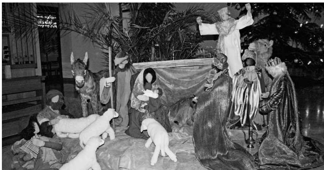
Die Krippe in der katholischen Kirche Bruggen.