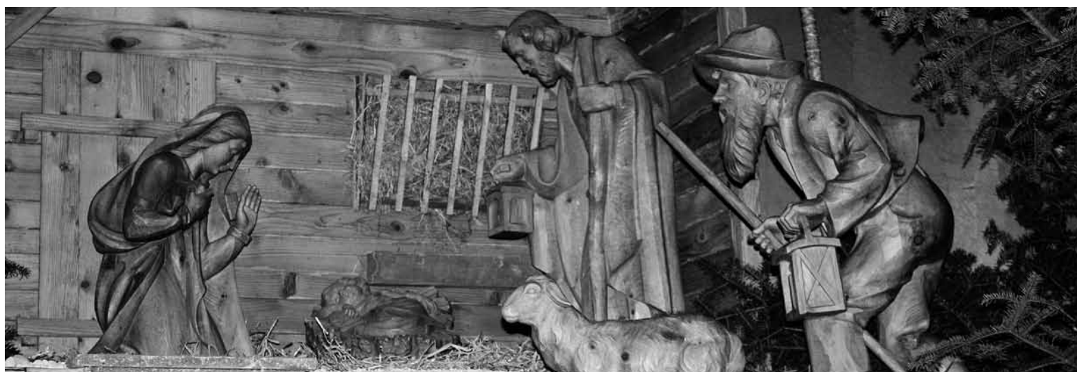
Krippe in der katholischen Kirche Abtwil