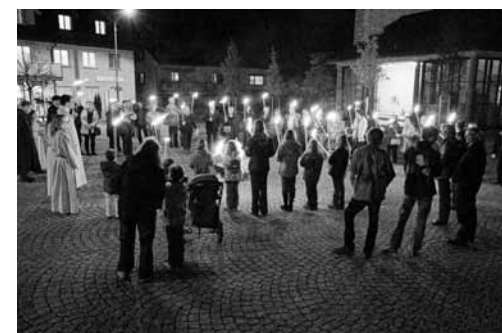
Aktives Mitwirken beim Familiengottesdienst zum Pfarreiabend.

Donnerstag, 15. Dezember, 14.30 Uhr: Adventstreff im Pfarreiheim