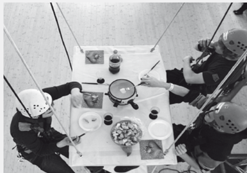
Gemeinsam am gleichen Strick ziehen, dann gelingen Projekte wie hier im Bild: Segeltörn und Fondueplausch in luftiger Höhe bei Extreme Heaven.