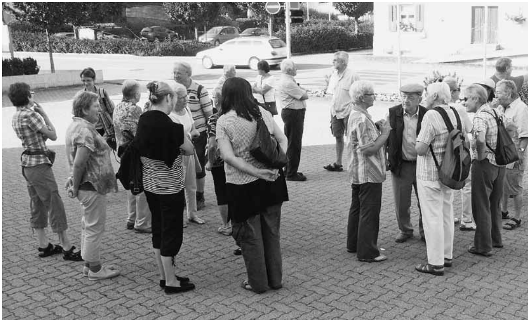
Die Gemeinschaft wie hier auf dem Pfarreiausflug wird in Wittenbach geschätzt.