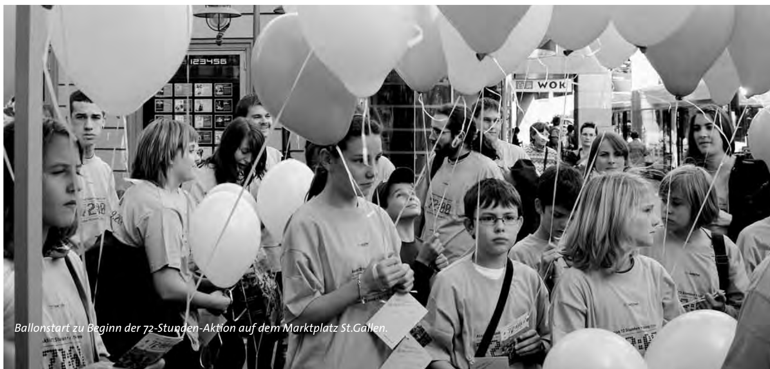
Ballonstart zu Beginn der 72-Stunden-Aktion auf dem Marktplatz St.Gallen.