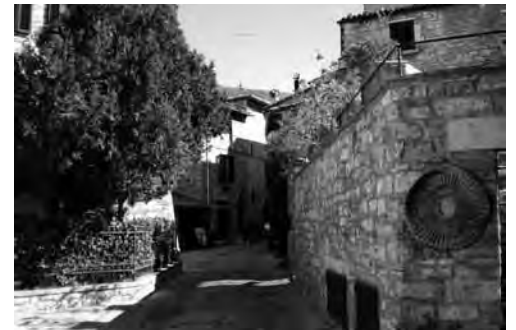
Das war Assisi 2010.

■ Erwachsenenbildungsangebote 2010/2011 Theologie heute IV – 5 Abende im Pfarrhaus Thema: Glaube, der bedrückt, oder Glaube, der befreit?