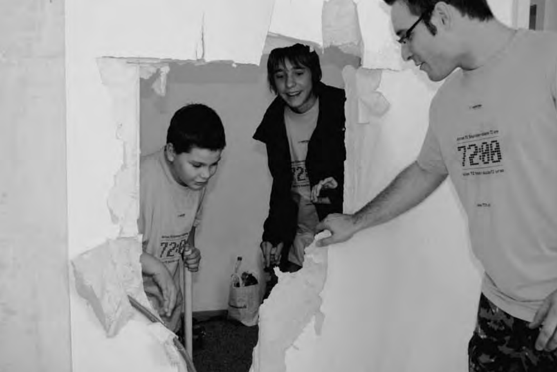
Abbruch einer Mauer im Büro von safranblau, dem Kirchen-Projekt für junge Erwachsene, im Rahmen der 72-Stunden-Aktion.