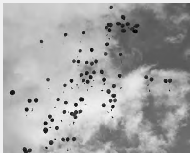
Bilder: Startschuss zur Aktion «72 Stunden» vom Yesprit-Team mit ca. 30 Jugendlichen und jungen Erwachsenen in der Stadt St.Gallen.

Detaillierte Angaben zu den Angeboten der kath. Jugendarbeit finden Sie unter www.yesprit.ch und in unseren vierteljährlich erscheinenden Jugendzeitschriften «Pepper» (für 13- bis 16-Jährige) und «mint» (für 17- bis 20-Jährige).