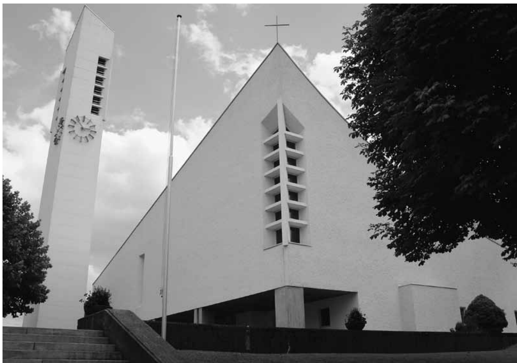
Die Pfarrkirche Bruder Klaus in Winkeln wurde 1959 eingeweiht.