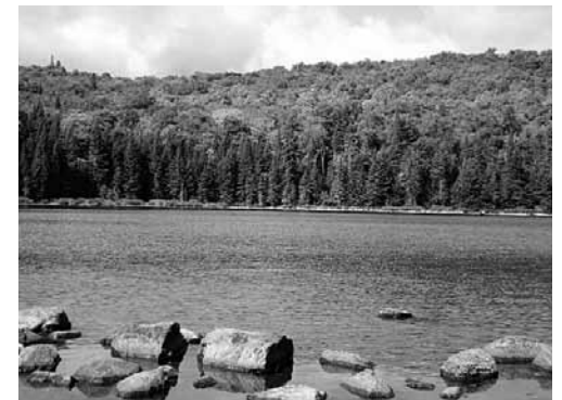
Grüsse aus Quebec.

In den Monaten Mai bis und mit September feiern wir den Gottesdienst am Donnerstagabend um 19.15 Uhr wiederum in der Kapelle St. Josefen, am Ort des Ursprungs von Pfarrei und Kirchgemeinde.