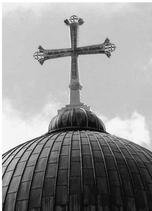
Kreuz auf der Kuppel der Grabeskirche in Jerusalem.

Nun, zunächst hatten die ersten Christen natürlich andere Gedanken und Anliegen, als sich mit Gegenständen und Reliquien des Lebens Jesu zu befassen. Bevor sie sich für das Kreuz interessierten, mussten sie erst den Sinn des Kreuzesgeschehens tiefer begreifen. Dennoch gab es schon früh ein reges Interesse an den geschichtlichen Stätten und Gegenständen des Lebens Jesu, auch am Kreuz. Dieses wurde nach einer gut bezeugten Überlieferung am 14. September 320 von