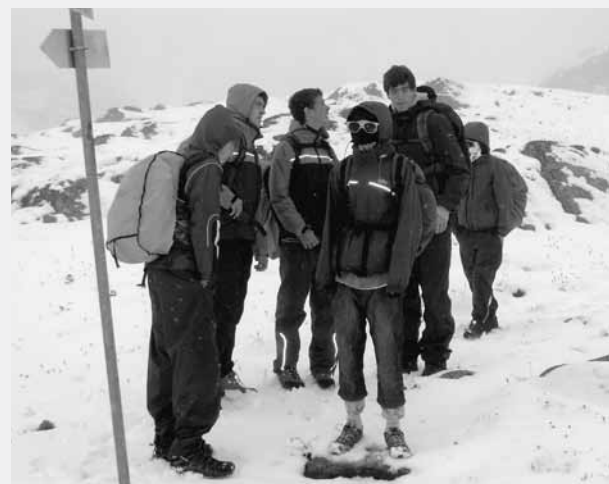
Bilder: Segeln auf der Liberté und Schnee im Sommer bei CH quer durch.