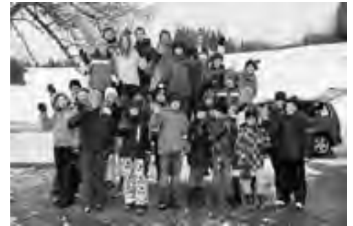
Im Dezember trafen sich die jüngeren Ministranten/-innen aus Abtwil und Engelburg zum Chlaus-Weekend im Hinterberg.

31. Januar, 18.15 Uhr im Figurentheater St.Gallen: «Jahre in der Wüste».