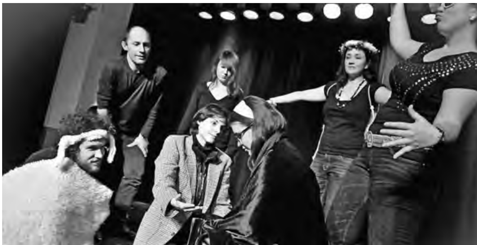
safranblau – Experimentelles Weihnachtstheater: Staunen um das Jesuskind: v.l.n.r. weisses Schaf, Hirt, Josef, schwarzes Schaf, Maria, Engel Gabriel, Engel Schneeflocke.