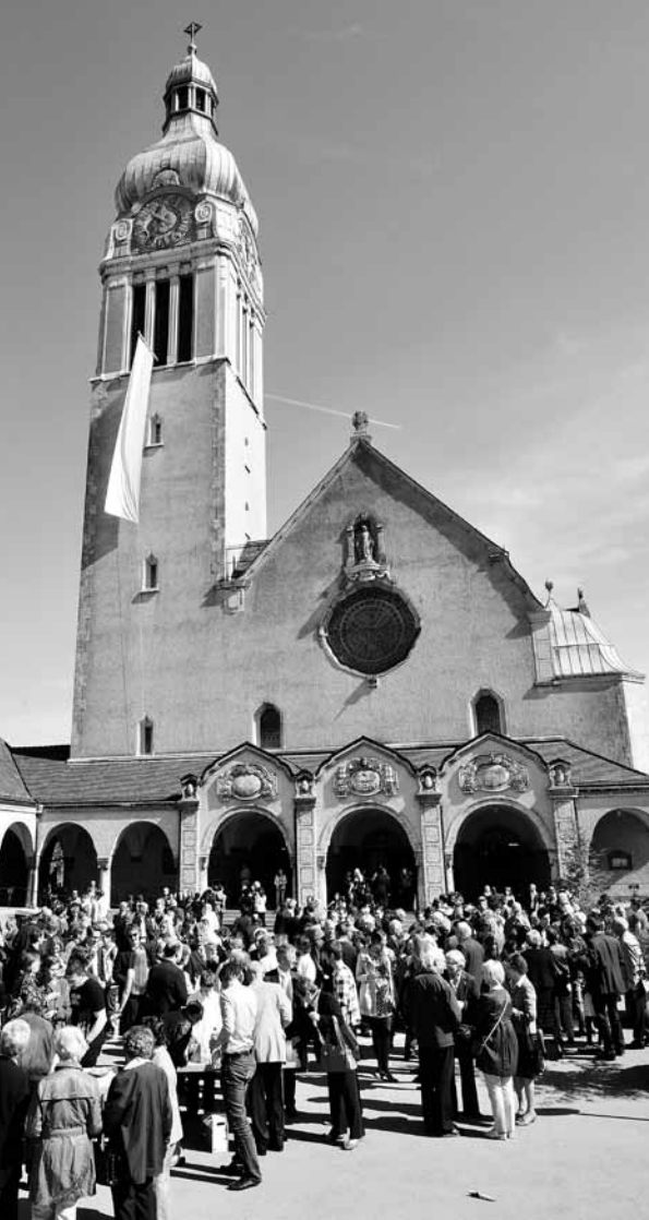
Die Kirche im Neudorf ist immer wieder Ort der Begegnung.