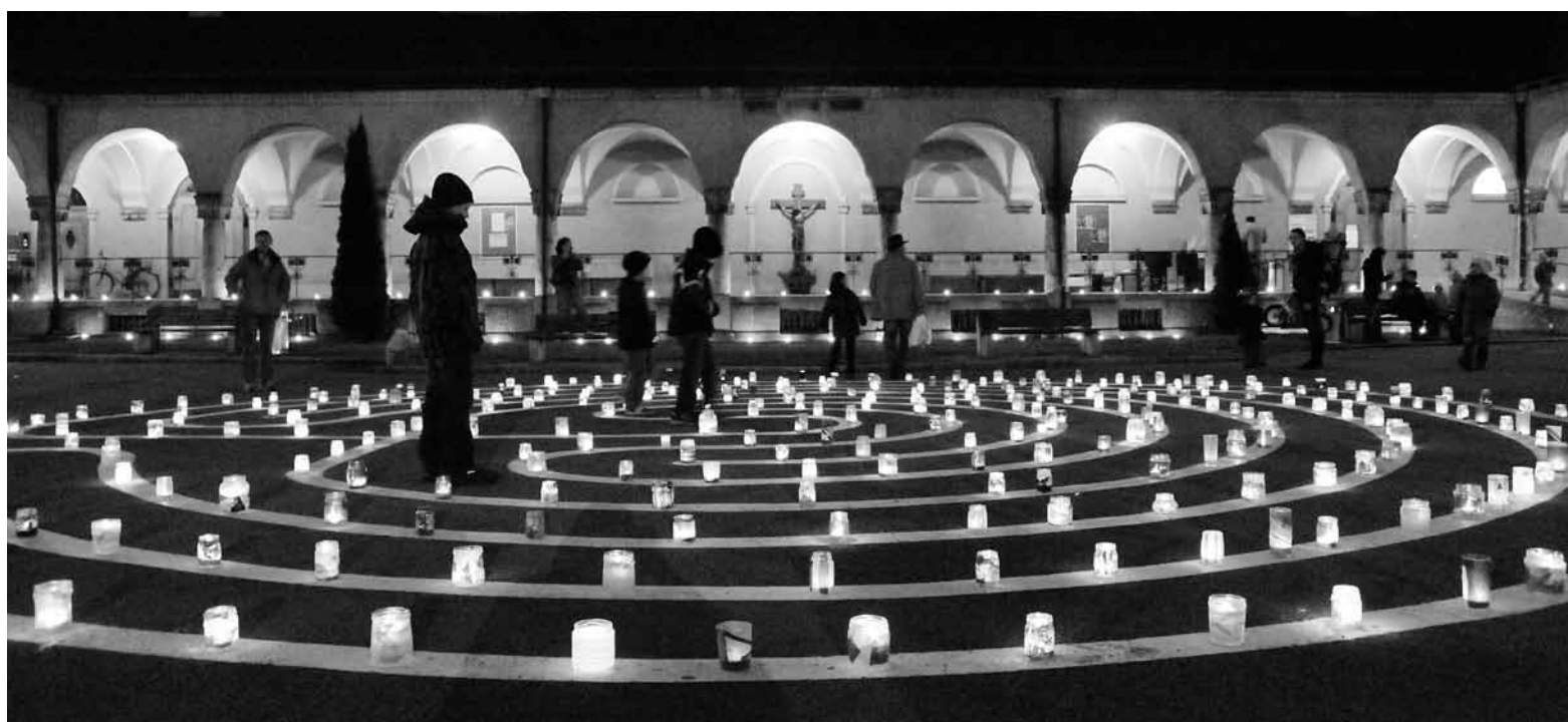
Das Lichtermeer ist ein geschätzter Pfarreianlass in der Pfarrei St.Maria Neudorf.