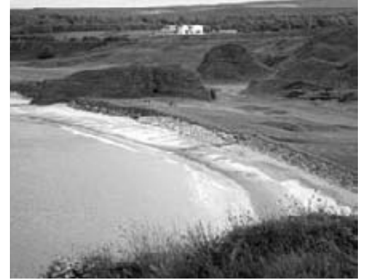
Cullen an der schottischen Ostküste.

■ 24. Juli, 9 Uhr Gottesdienst in St. Josef, anschliessend Apéro