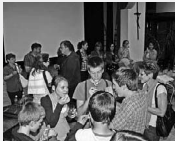
Bilder: Informationsabend Segeltörn