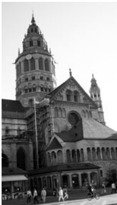
Der Mainzer Dom mit der „Nr. 10 am Domplatz“, Anlauf- und Informationsstelle der kath. Kirche.

An der Sitzung vom 19. Oktober 2005 hat die Steuerungsgruppe von den vielfältigen Aktivitäten der Seelsorger/innen, der drei Pastoralteams a.i. sowie des Dekanatspastoralteams Kenntnis nehmen können. Die drei Seelsorgeeinheiten sind je mit eigenen Anlässen in die weiteren Entwicklungsschritte gestartet. Die Steuerungsgruppe spricht allen Beteiligten einen grossen Dank aus. Den Pastoralteams a.i. und ihren Mitwirkenden in den Pfarreien sowie dem Dekanatspastoralteam