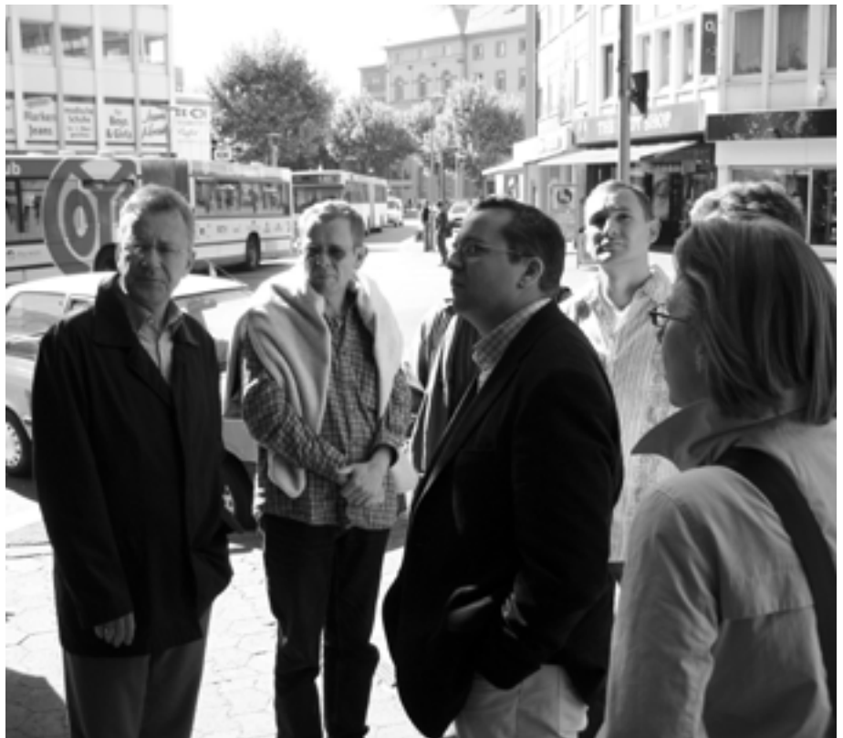
Mitglieder des St.Galler Dekanats-Pastoralteams informieren sich in Mainz über das Projekt „Atempause“.

Wir freuen uns, bei Ihnen vorbei zu kommen!