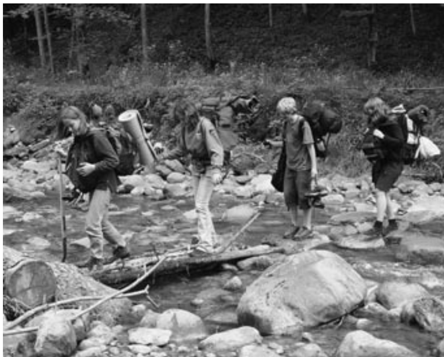
Eine der Zielsetzungen kirchlicher Jugendarbeit für die 12 - 16 Jährigen ist es, mit erlebnisorientierten Projekten die Jugendlichen zu reflektierten Erfahrungen zu führen, die sie fürs Leben fitter machen.

den immer wieder damit konfrontiert: Jugendarbeitslosigkeit, Armut, Suchtverhalten, Suche nach Sinn, Individualisierung, Suche nach Gleichgesinnten und Gemeinschaft usw. Diese Realitäten lassen Fragen aufkommen: Wo halten sich die Jugendlichen unseres Lebensraums auf? Welche Themen bewegen sie? In welchen sozialen Milieus bewegen sich Jugendliche und wo finden wir Anknüpfungspunkte? Wie gelingt es uns, Jugendliche in ihren Nöten zu erreichen und sie bei ihren Bedürfnissen abzuholen? Ist eine Jugendarbeit mit aufsuchendem Charakter nötig? Das Leitziel aus unserem Begleitbild gibt uns in diesem Suchen auch weiterhin Orientierung: „Kirchliche Jugendarbeit fördert Beziehungsfähigkeit des jungen Menschen zu sich, zu anderen, zur Welt und zu Gott. Sie orientiert sich am Leben und an der Botschaft von Jesus.“